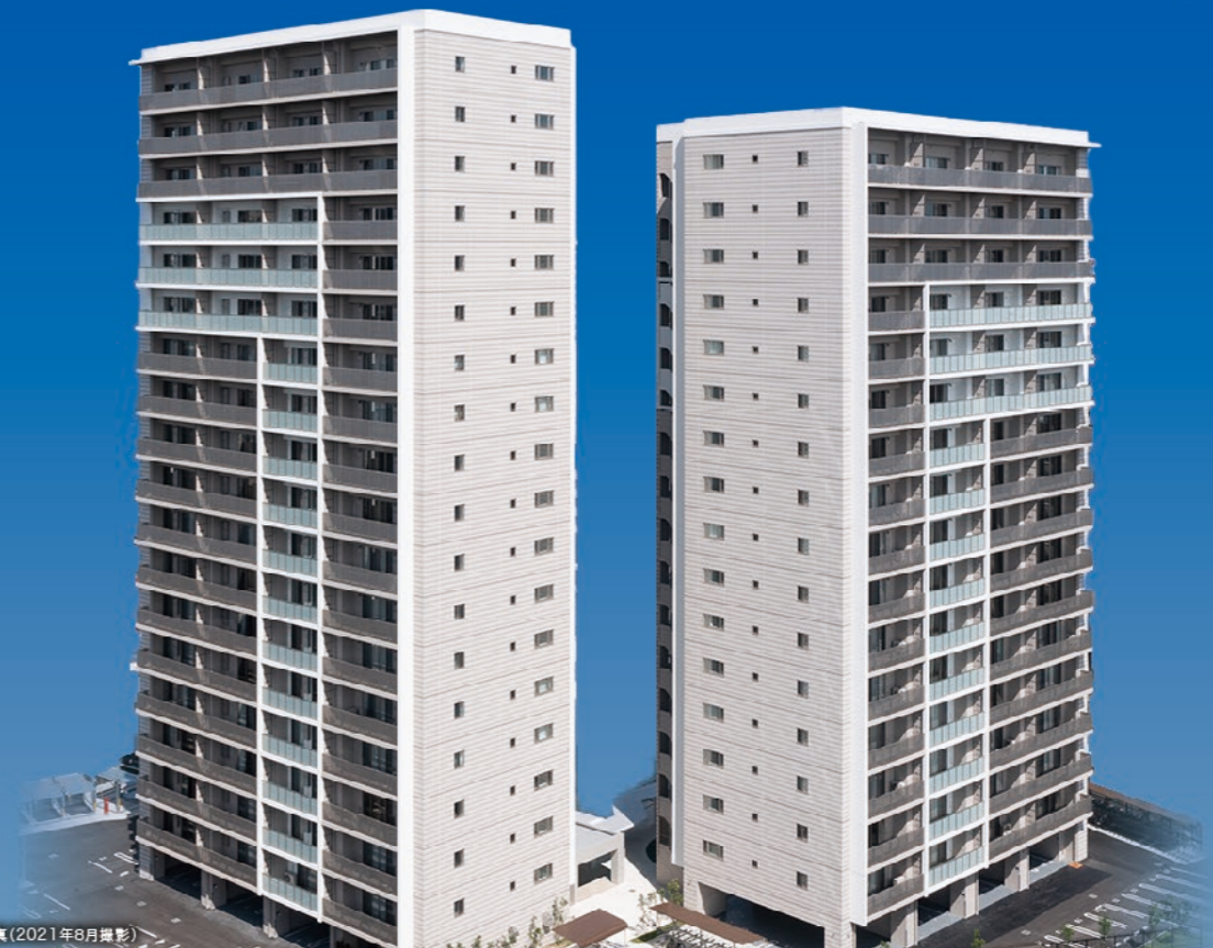
※外観写真(2021年8月撮影)

おかげさまで、2022年、2023年、2年連続販売戸数北九州市No.1、※2 ※2 株式会社九州マーケティングセンター調べ(2024年2月1日)